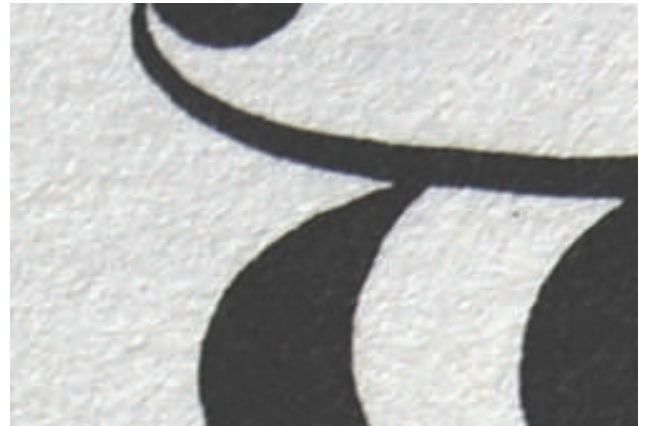
An der Buchstabengrenze zeigt sich deutlich die Faserstruktur des Trägermaterials Papier.

Die Suche nach einem Material, auf dem sich geschriebene Informationen übermitteln und erhalten ließen, hat im Verlauf der Menschheitsgeschichte zu den unterschiedlichsten Lösungen geführt. Viele alte Kulturen verwendeten Stein, Metall, Holz, Wachs- oder Tontafeln als Informationsträger. Diese Materialien wurden nach und nach durch solche ersetzt, die flexibler waren, sich billiger oder einfacher herstellen ließen, und die man leichter transportieren konnte.