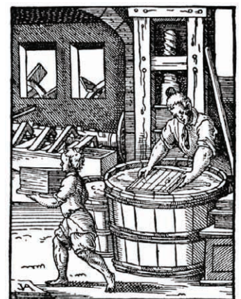
„Der Papyrer“ aus dem Ständebuch von Amann

Der Siegeszug der Papiermacherei setzte sich unaufhaltsam quer durch Europa fort und Ende des 16. Jahrhunderts produzierten allein in Deutschland bereits 190 Papiermühlen.