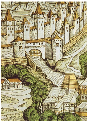
Die „Gleismühl“ vor den Toren Nürnbergs, am Ufer der Pegnitz

Die Mauren brachten das Papier nach Spanien, wo 1151 in Xativa die erste Papiermühle entstand. Die älteste heute noch betriebene Papiermühle befindet sich seit 1276 in der „Papierstadt“ Fabriano bei Ancona in Italien. Dort wurde vermutlich auch das Wasserzeichen erfunden. In Deutschland, gründete Ulman Stromer 1390 bei Nürnberg die erste Papiermühle, die „Gleismühl“.