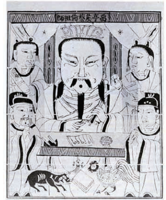
Ts'ai Lun

Nach seiner Methode wurde ein Faserbrei aus Bambusrinde, Maulbeerbast, Chinagrass, Baumwolle und Seide in einem Bottich („Bütte“) angerührt und in einer dünnen Schicht in einen Schöpfrahmen gefüllt. Nach dem Trocknen wurde die Schicht abgenommen und gepresst. Heute bezeichnet man auf diese Weise hergestelltes Papier als „Büttenpapier“.